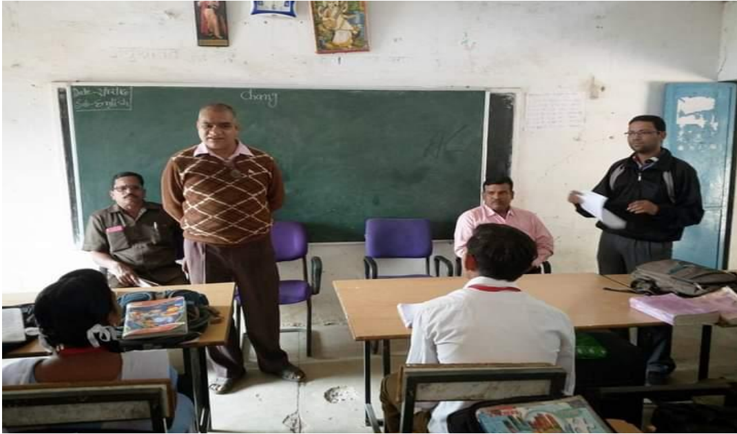
Visits to nearby schools to increase the rate of GER 2017