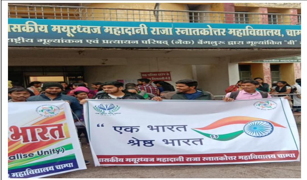
EK BHARAT SHRESHTA BHARAT