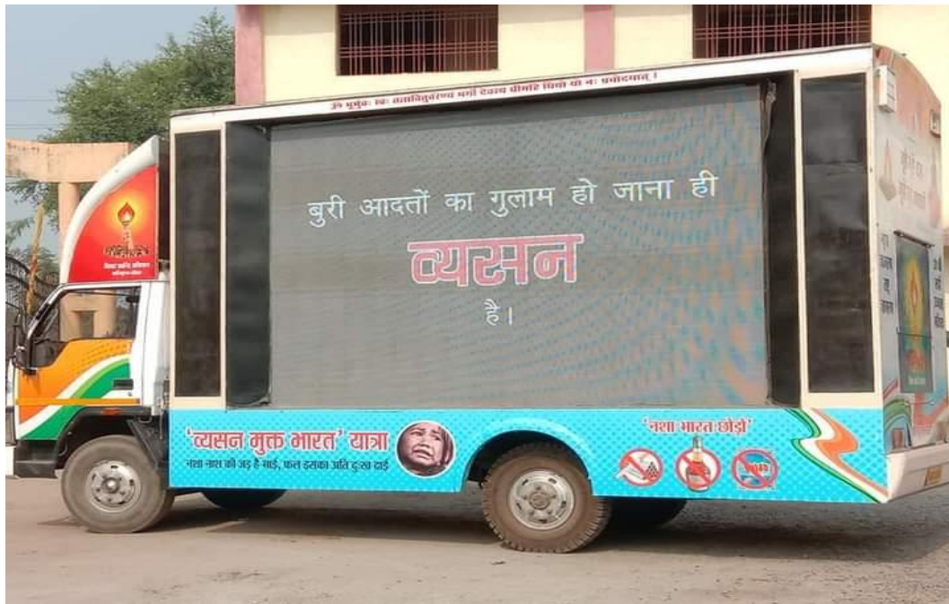
Community activity with the members of Gayatri Parivar 1 2019