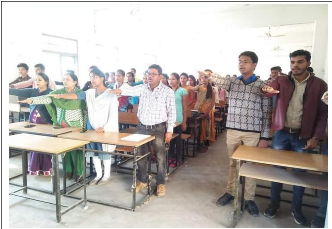
Communal Harmony Day