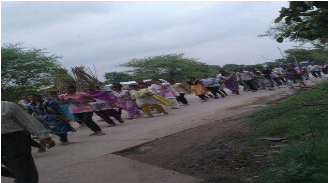
Swachhhta rally in the town 2017