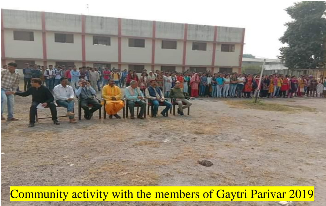
Community activity with the members of Gaytri Parivar 2019