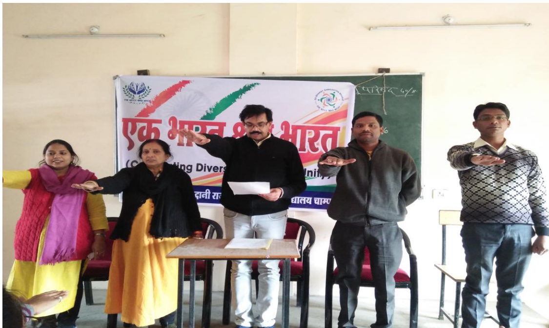
EK BHARAT SHRESHTA BHARAT