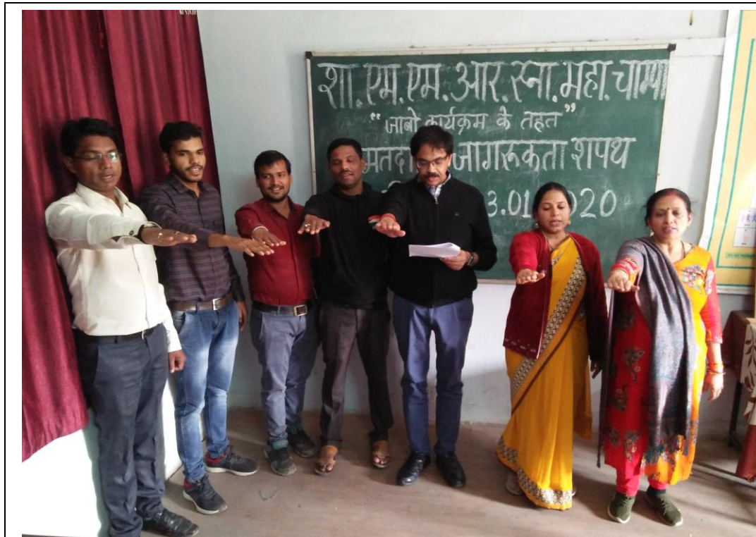
Electoral Voter Awareness