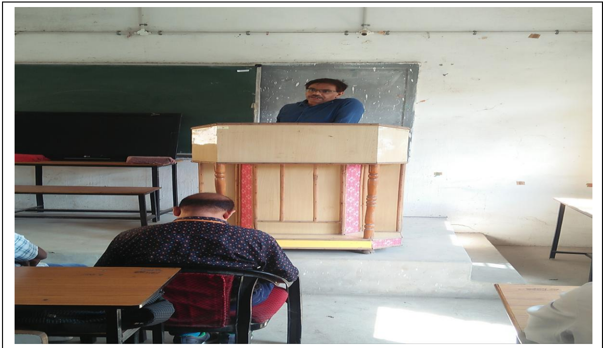
MAN KI BAAT Broadcast