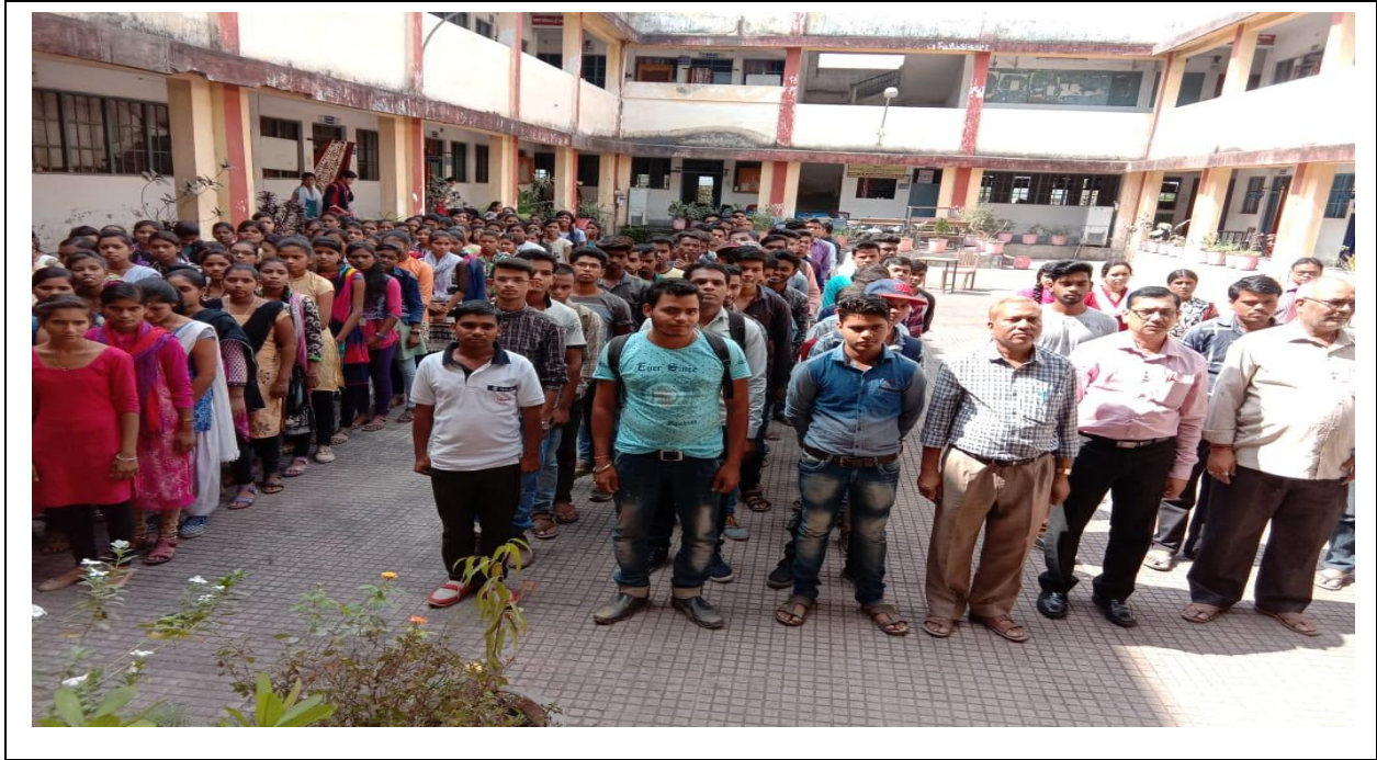
Oath taking ceremony on Constitutional day