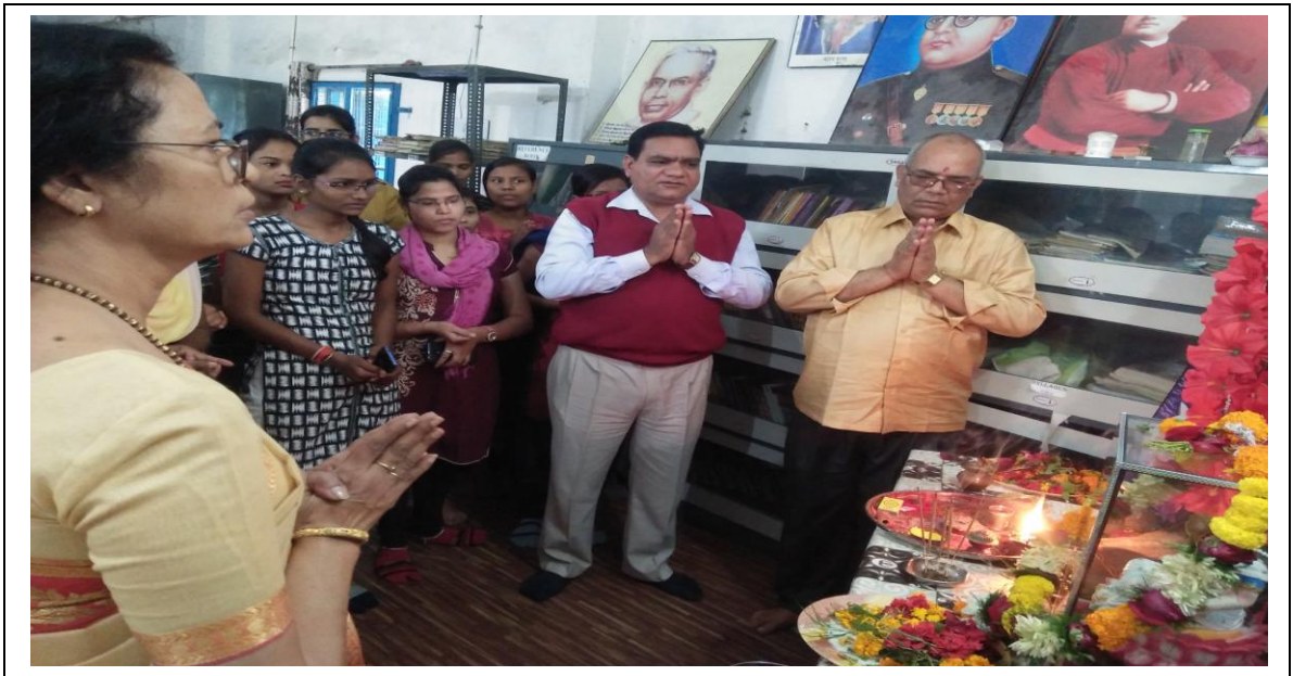
Sarswati Puja on Basant Panchami 2019