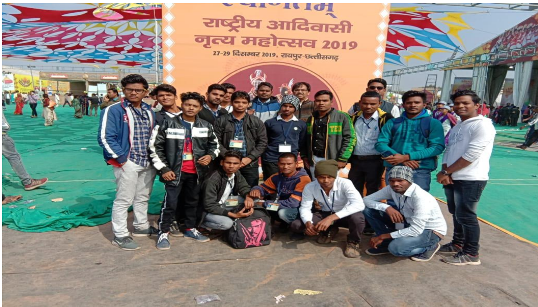
Participation in Tribal Dance Festival 2019