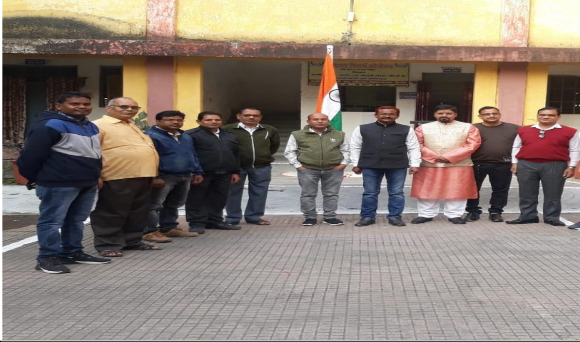
Republic Day Celebration