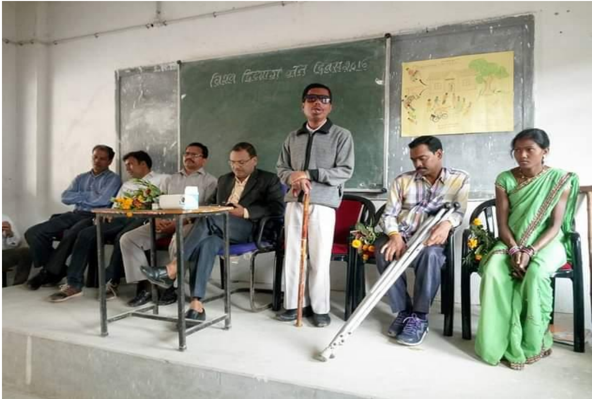
World Physically Challenged Day 2016